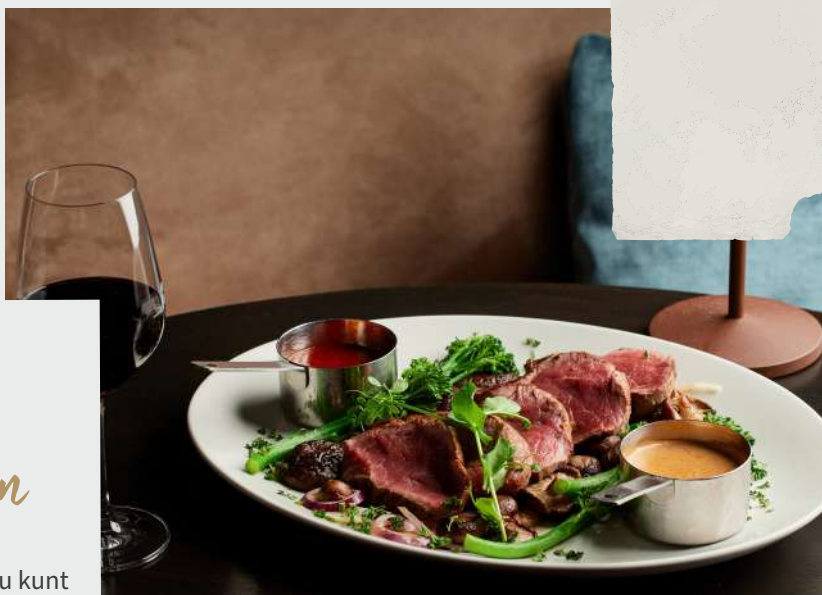
Chateaubriand van ossenhaas

Op pagina 11 vindt u al onze extra's die u kunt bijbestellen. Geniet van heerlijke loaded fries met truffelmayonaise en verschillende sauzen, perfect als aanvulling op uw vleesgerechten.