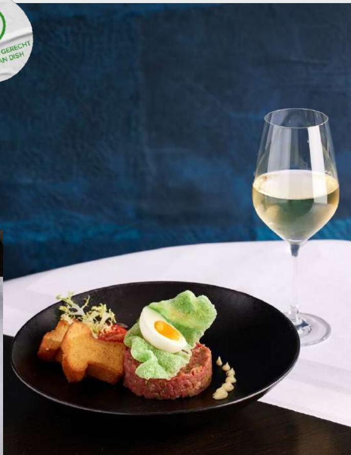
Klassieke steak tartaar