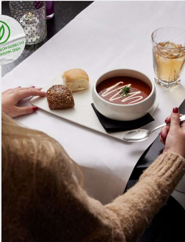
Tomatensoep à la Valk