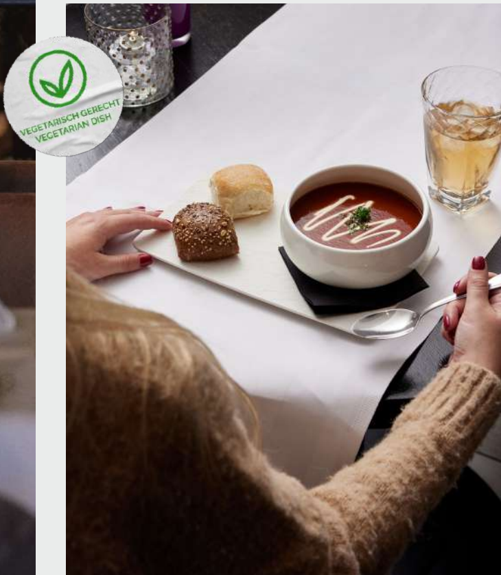
Tomatensoep à la Valk